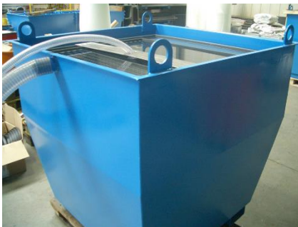
MBM ASEX MBM ASEX

The sludge extraction system ASEX has been developed for small water jet cutting basins until 4 m 2 surface.