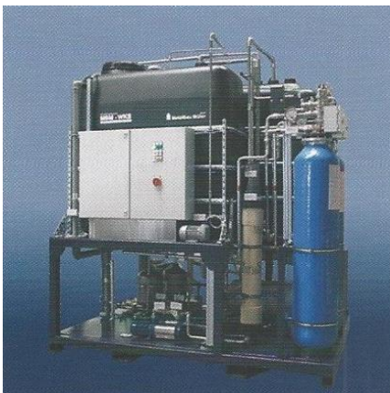
MBM WKS MBM WKS

The newly developed system MBM-WKS allows you to recirculate the abrasive water used for cutting by up to four cutting heads in a closed loop. Thus, drinking water is being conserved environmentally friendly and no additional chemistry is used.