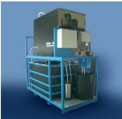
MBM WKS MBM WKS

The newly developed system MBM-WKS allows you to recirculate the abrasive water used for cutting by up to four cutting heads in a closed loop. Thus, drinking water is being conserved environmentally friendly.