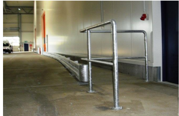
Absicherung einer Ladestraße mit Geländer

Auf dem Firmengelände oder in der Werkhalle ist die Gefahr von Beschädigungen durch Gabelstapler, Transporter oder LKW's täglich gegeben. Ein Schutz durch die individuell angepassten Konstruktionen der Metallbau Müller GmbH erspart Ihnen kostenaufwendige Reparaturen.