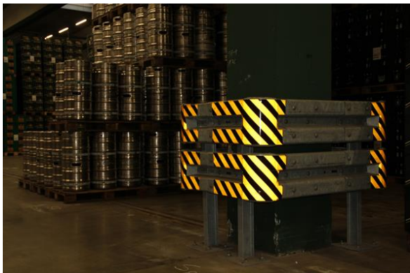
Säulenschutz einschließlich Signalfolie

Durch die zusätzliche Verwendung von Signalfolie wird die Wirkung des Anfahrsschutzes verstärkt.