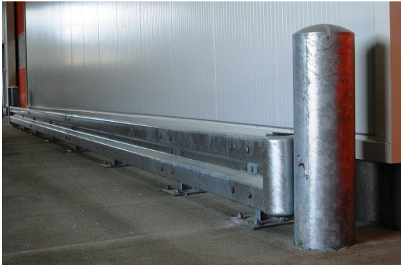
Absicherung einer Ladestraße