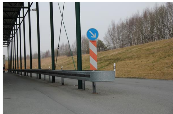
Säulenschutz einer Ladestraße