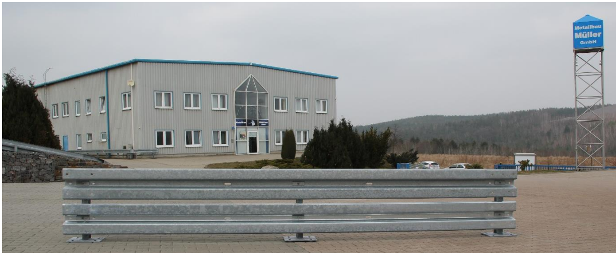
Anfahrerschutz in Kombination mit Unterfahrerschutz für Gabelstaplerverkehr und zum Schutz von Maschinen

Der Anfahrerschutz dient ebenfalls zur räumlichen Begrenzung von Fahrbahnen, Parkflächen und Transportwegen in Fertigungs- und Lagerhallen.