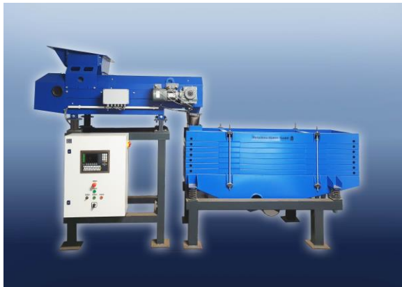
MBM Mehrdecksiebmaschine MBM multi-deck screening machine

The multi-deck screening machine from Metallbau Müller GmbH, called MBM-MDS, offers the optimum solution when many separating cuts in the fine and ultra-fine grain areas are required. The machine is placed in the separation of free-flowing, dry or granular bulk solids. The machine is already used in the classification of foods, industrial minerals, chemical products, ores and metals.